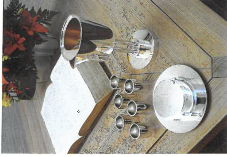
Altersølvet og alterlysestagerne i sølv med fod af moseeg er udført af sølvsmeden Ib Bluitgen. Se folderens bagside.

Læs mere om kirken og hvad der ellers sker i Solrød Sogn på www.solrodkirker.dk